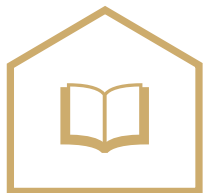
SZKOŁA PODSTAWOWA 8 LAT

Chcąc zostać sprzedawcą należy wybrać odpowiednią szkołę.