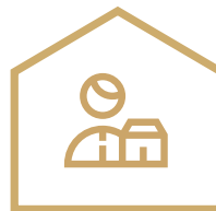
SZKOŁA DLA SPRZEDAWCÓW