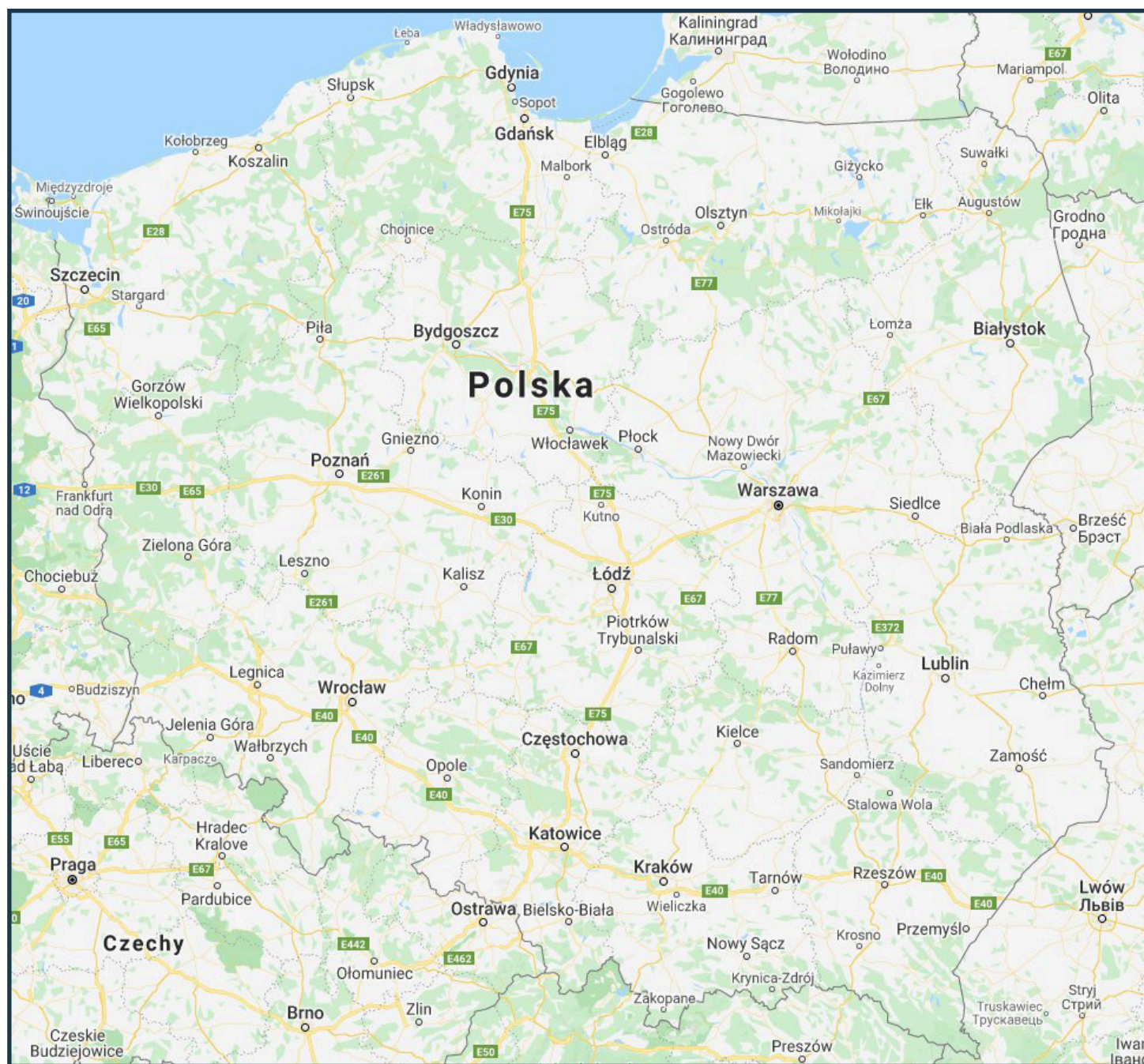
Orientacyjna mapa szkół prowadzących kształcenie w zawodzie TECHNIK GARBARZ w roku szkolnym 2020/2021