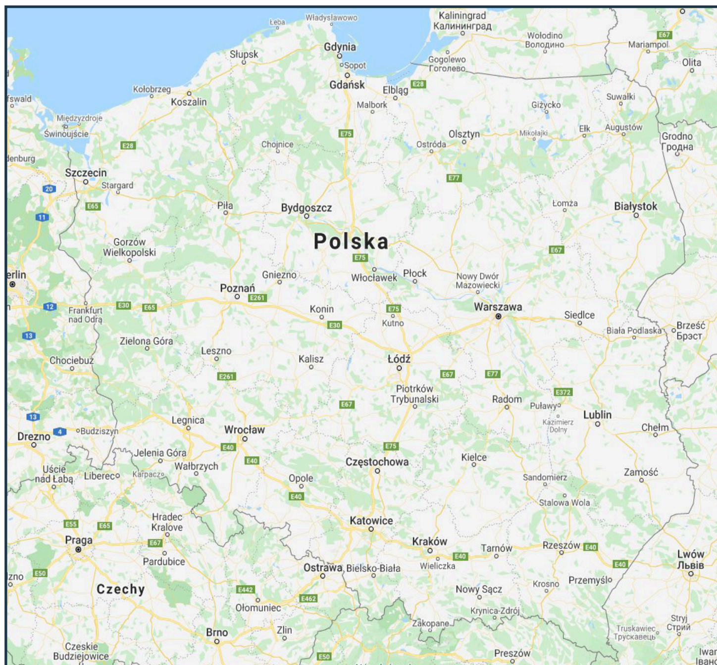
Orientacyjna mapa szkół prowadzących kształcenie w zawodzie ZDOBNIK CERAMIKI w roku szkolnym 2020/2021